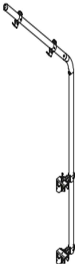
KL - A